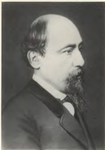
Н. А. НЕКРАСОВ Фотография 1870-х годов.